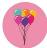
Animation locale, culture, sports et loisirs