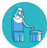
Cadre de vie, propreté